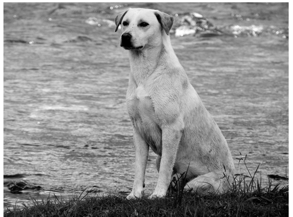
“Sabiduría canina” por Susana Vilchez

En definitiva, desde que el ser humano creó el lenguaje se ha dedicado a analizar su propia existencia, encontrando en su medio cercano las respuestas más necesarias y los interrogantes más insondables. Mientras la humanidad prosiga su camino por la historia, seguirá transitándolo de la mano del lenguaje, que en sus múltiples formas se presenta como un universo infinito de posibilidades que encuentra en la naturaleza su principal fuente de sabiduría, porque “a buen entendedor, pocas palabras”.