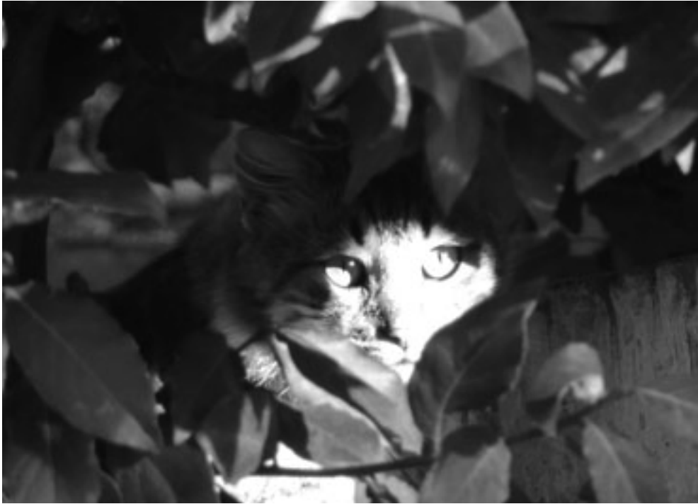
“Astucia felina” por Susana Vilchez